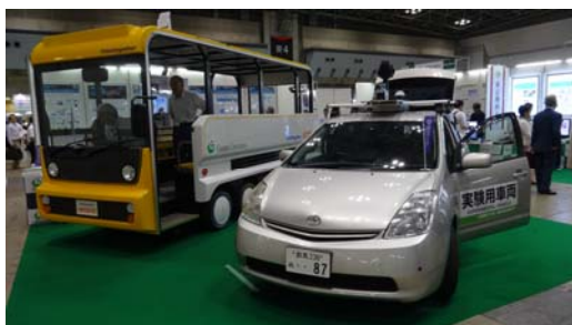
展示した自動運転実証実験車両